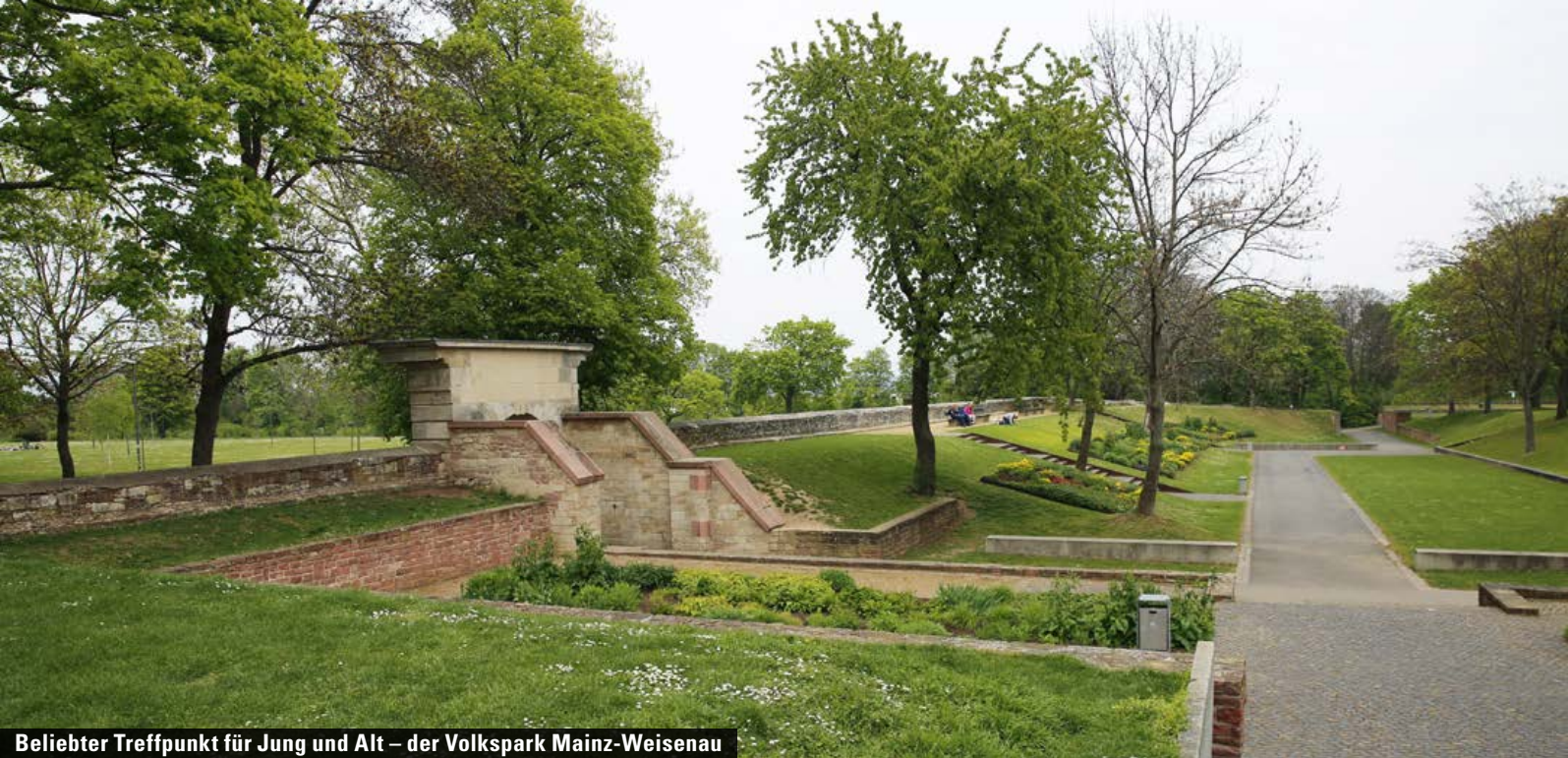
Beliebter Treffpunkt für Jung und Alt – der Volkspark Mainz-Weisenau