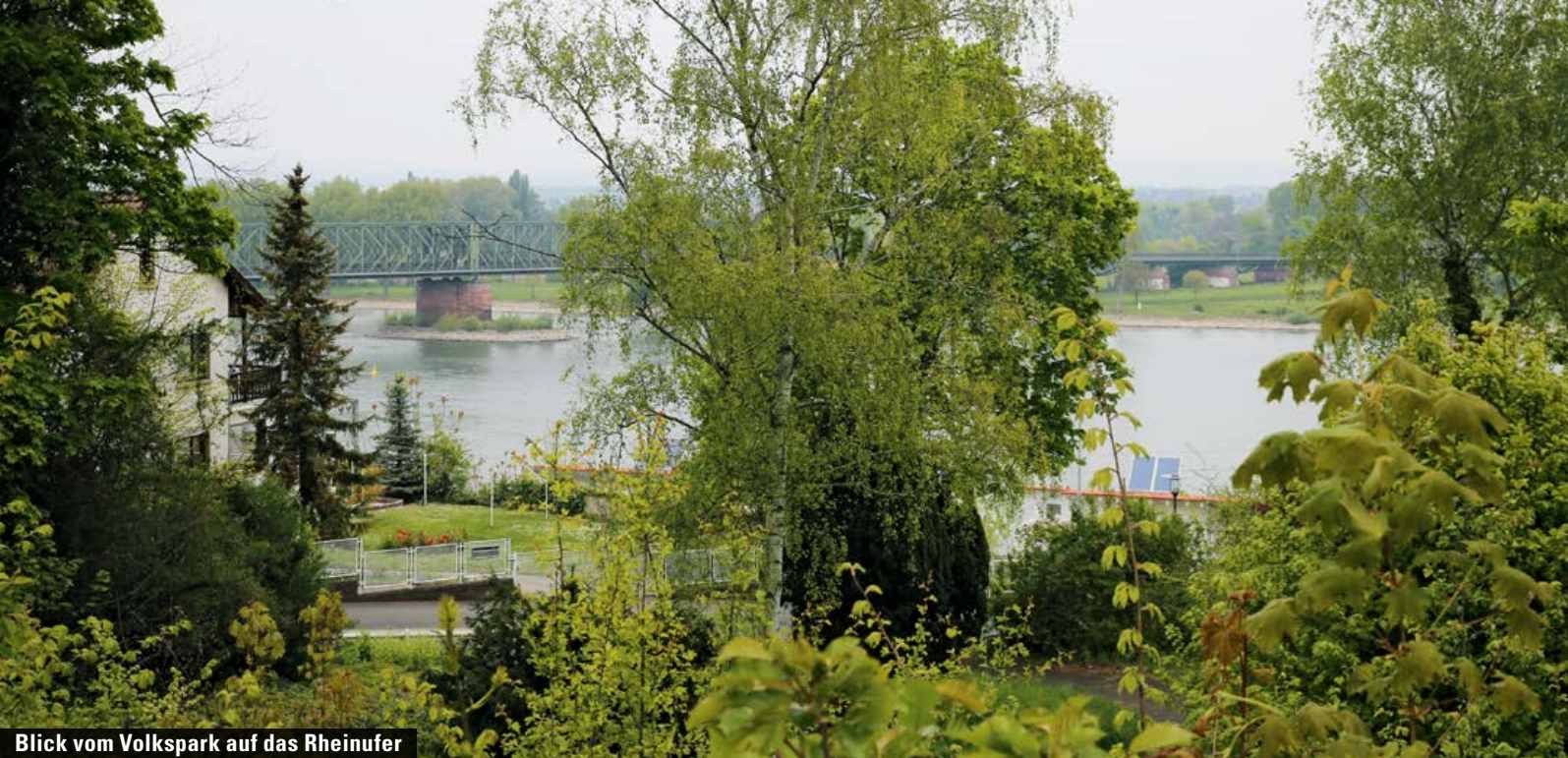
Blick vom Volkspark auf das Rheinufer